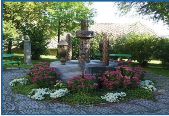
Elter-Brunnen im Park