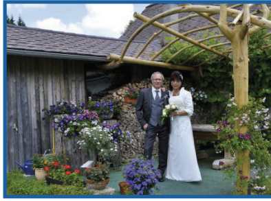
Garten Schlesinger Teich